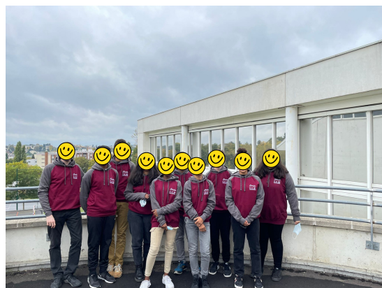
Remise des sweats au logo et aux couleurs de la cordée Lakanal

Depuis l'année dernière, notre établissement s'inscrit dans le dispositif national des cordées de la réussite. Cette année, dix élèves de 3e ont intégré la cordée "Ambition CPGE" du lycée Lakanal et deux élèves participeront à celle du lycée Henri-IV intitulée "Tremplin pour le lycée". Diverses activités leur seront proposées le mercredi après-midi dans le but de les préparer à un parcours d'études ambitieux.